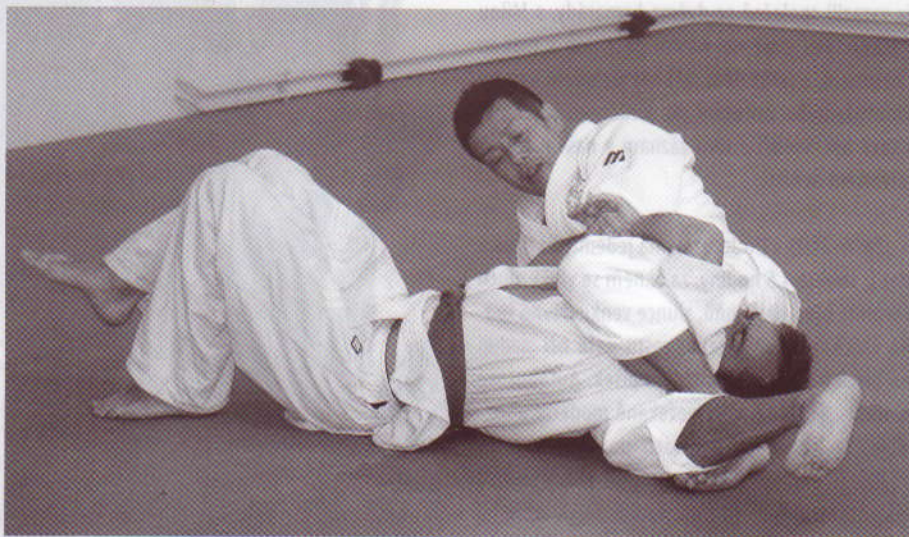
Mistr zneškodňuje protivníka při jedné ze svých oblíbených technik boje na zemi.